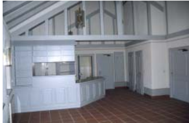
Innenansicht Gadenblock A nach der Sanierung

Schank- und Sanitäreinrichtungen ausgebaut. Dabei wurde eine versetzt gestaffelte Dachlandschaft geschaffen, um die historische Parzellenstruktur der einzelnen Gaden aufzugreifen. Weitere Gaden werden wieder als Lagerräume genutzt.