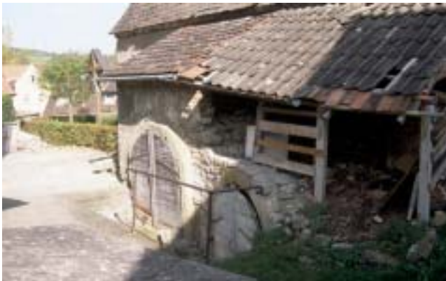
Gadenblock B vor der Sanierung