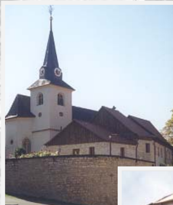
Kirche mit Gadenblock A

Ausgelöst durch die Überlegungen der Dorferneuerung hat der Markt Seinsheim in intensiver Zusammenarbeit mit der Arbeitsgemeinschaft Kirchenburg, den Fachbehörden und vielen Bürgern die Sanierung der Kirchengaden durchgeführt. Die Teilnehmergemeinschaft unterstützte das Vorhaben durch Neuordnung des Eigentums und Förderung aus dem Bayerischen Dorfentwicklungsprogramm.